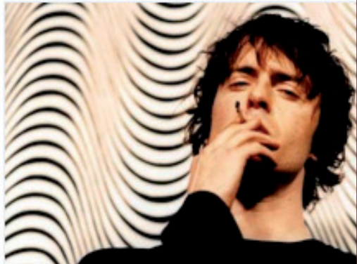
Jason Pierce a arrêté la drogue, pas le rock'n'roll. Pour faire passer le message, il a fondé Spiritualized.